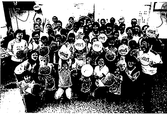
不僅贊助課輔經費，安麗夥伴也上山陪伴阿里山豐山國小學童並教導手作DIY