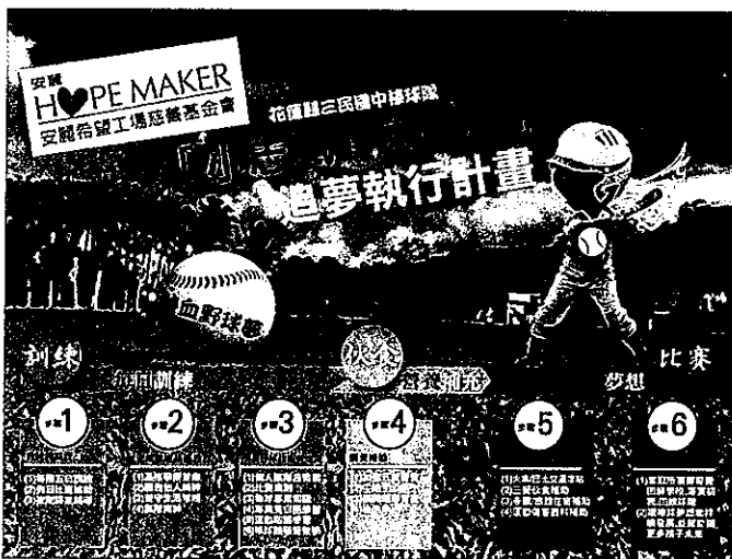
花蓮三民國中棒球隊透過追夢基金挹注，希望能持續追求棒球夢，打一場逆轉人生的比賽