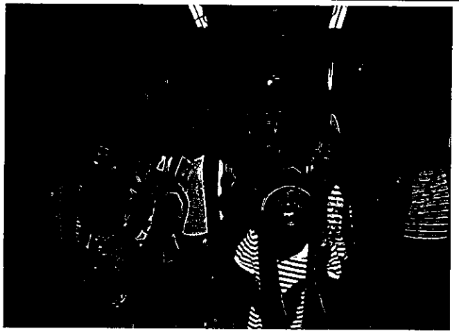
不僅贊助山美部落教室課輔經費，安麗夥伴也捐助保暖物品讓山上的孩子們感受溫暖