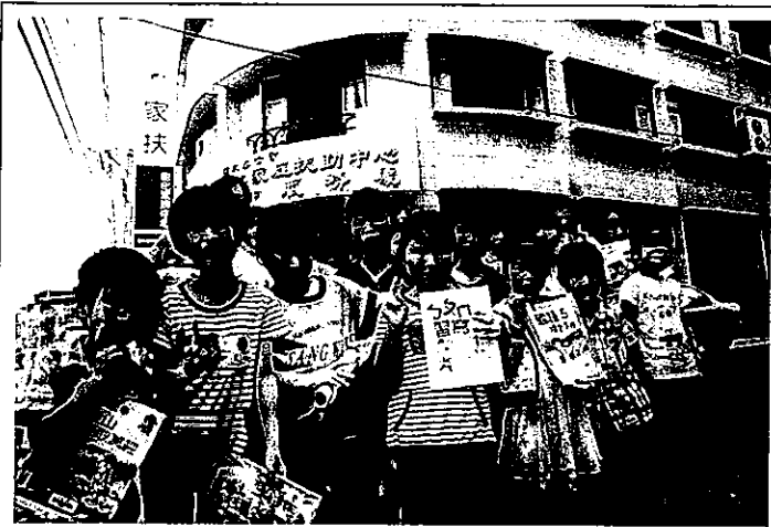
基金會贊助家扶全台 43 個課輔班，透過家扶完整的課後照顧，讓偏遠弱勢孩童也有希望的未來