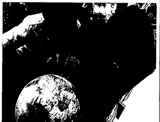
花蓮五味屋透過追夢基金挹注，希望能圓滿每位小老闆們的夢想