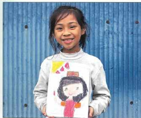
▲許多孩子們和小雙一樣，在方舟教室裡快樂學習、健康成長。