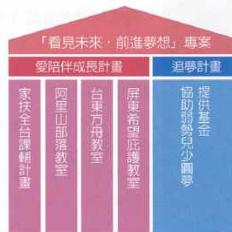
安麗希望工場慈善基金會專案架構

自 2012 年底成立至今，基金會成功匯聚了許多資源、愛心與力量。透過專案的推動與執行，我們在 2012 年幫助全台 1,400 多位弱勢學童獲得更好的學習與教育機會，2013 年則增至 1,700 多位；另外，藉由「追夢計畫」的陸續展開，我們幫助更多孩子們勇敢追夢，看見屬於自己的希望與未來。