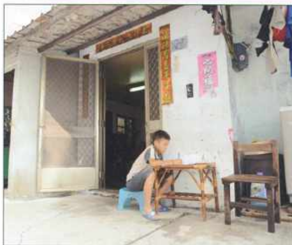
▲小明和阿嬤一起住在租來的老房子裡，阿嬤靠資源回收獨力扶養五個孫子。