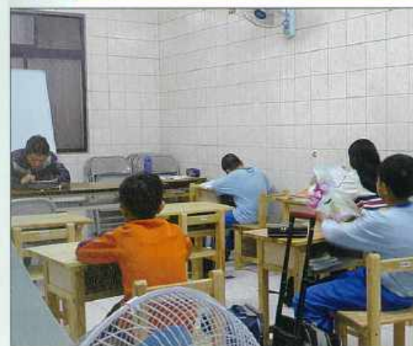
▲因為有了屏東希望庇護教室，許多像小鞍一樣無法得到政府補助的孩子，得以受到照顧。