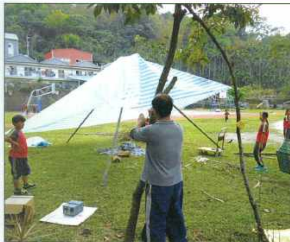
▲新美國小的孩子們喜愛科學，並對天文探索充滿熱情。