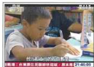
電視媒體：合計報導 13 則

2013年我們的行動引起了大眾及媒體的關注，受到電視、平面媒體與網路媒體報導，總計共達70則。