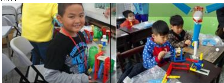
新住民小瑋開心地完成水力發電機模型