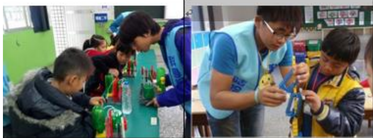
鮪魚哥哥認真教導