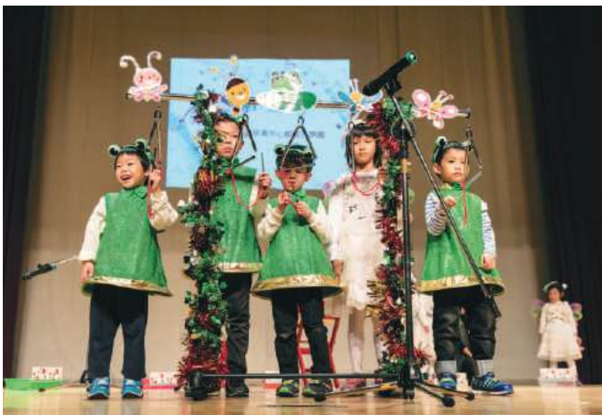
財團法人第一社福基金會