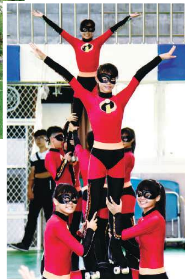
台北市明道國小溜冰隊

池上鄉伯朗大道旁的萬安國小是一所僅40餘位學童的偏鄉小學。基金會贊助貓頭鷹親子教育協會在該校推動的「為愛朗讀」親師生共讀活動，讓許多學童愛上閱讀，也讓親子與師生間的關係變得更緊密。不僅如此，這群後山的孩在2017年的盛夏成功站上台北的大舞台，在300多人面前齊聲朗讀，獲得滿堂彩，也實現了他們從偏鄉到城市的夢想。