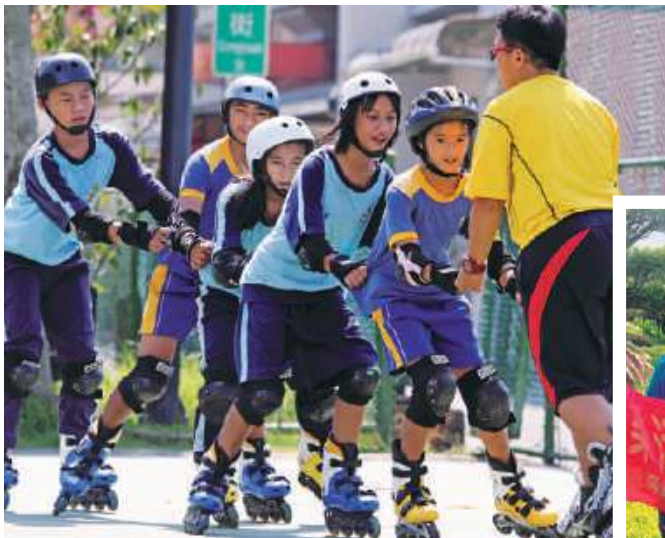
南投信義國小身心障礙學生直排輪訓練營

南投信義國小從10年前就開始帶著特教班孩子們溜直排輪，培養他們的平衡感與肌力。2017年在基金會追夢計畫的贊助下，他們更邀請南投水里國中、國小的身障孩童一起加入。這個對一般孩子來說稀鬆平常的運動，對他們來說可是一大挑戰，看著他們展現不輕言放棄的決心與毅力，也真的完成了這個看似平凡、卻是意義不凡的夢想。