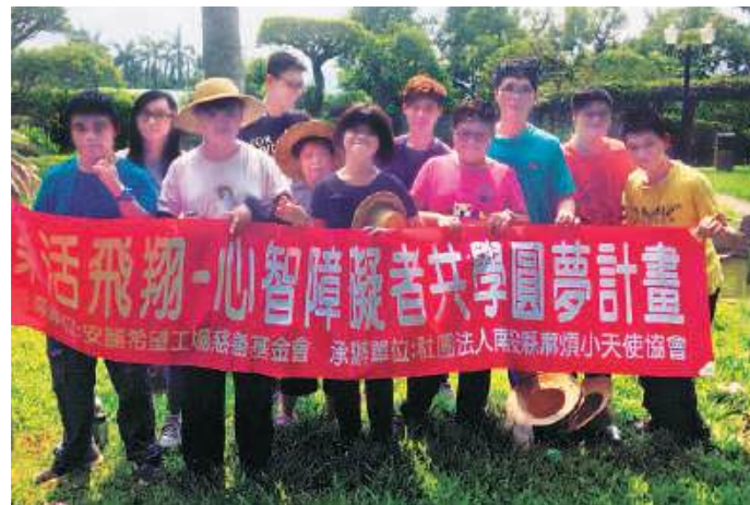
南投縣麻煩小天使協會

為了幫助發展遲緩與心智障礙的孩子提升人際溝通與自主能力，南投麻煩小天使協會推出的「樂活飛翔—心智障礙者共學圓夢計畫」，讓這些小天使藉由與當地國中小學生一起參與食農教育體驗，互相交流並獲得園藝治療的效果。2017年麻煩小天使協會共舉辦了62場社區參訪、農耕見習與食農教育活動，總計有1,252人次參與。小天使們不僅交到了新朋友，更因為夢想實現而滿心喜悅！