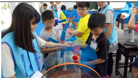
小朋友製作的風力發電機轉得好快啊!