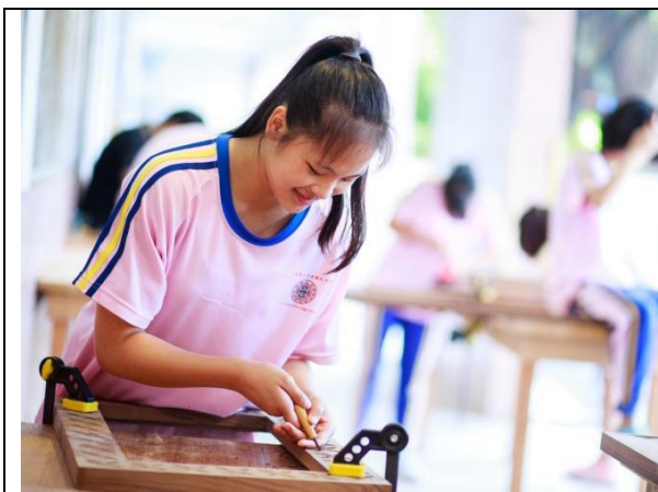
同學們經常利用下課時間來雕刻