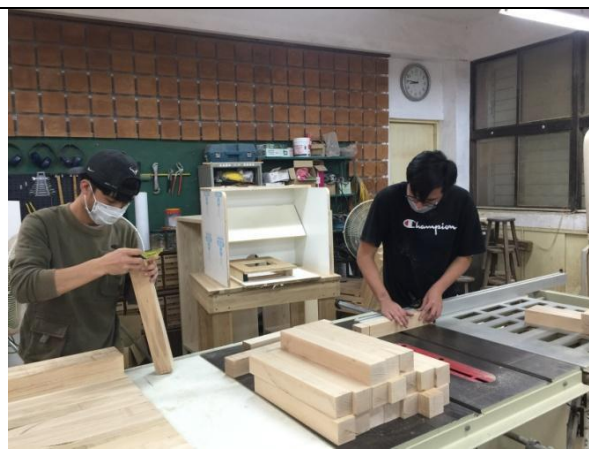
量測是最重要的工作