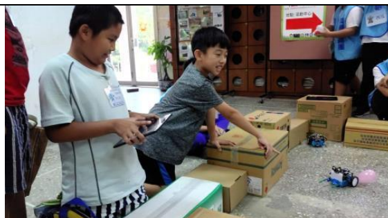
小正用平板操控 MBOT 玩戳氣球。