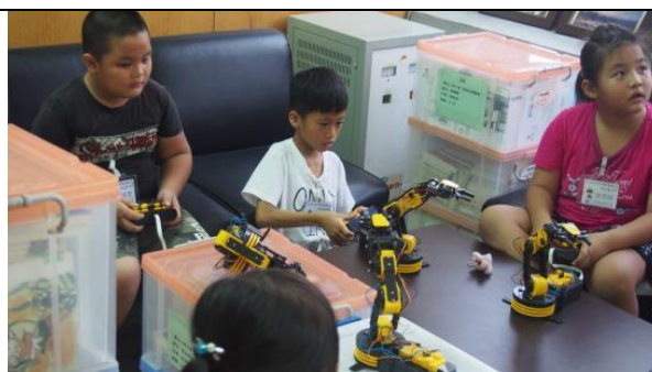
機器手臂的夾筆闖關很刺激!